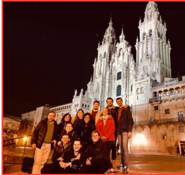
Foto de la última Reunión Nacional en la Plaza del Obradoiro, Santiago de Compostela

Estas reuniones suelen suceder dos veces al año y se intenta rotar el sitio en el que tiene lugar.